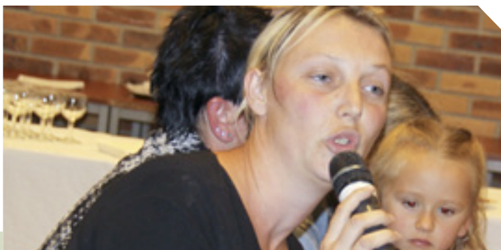
10 septembre 2010, Réunion Publique Logement