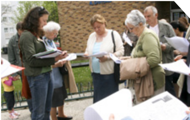
Diagnostic en marchant à la Grande Résidence