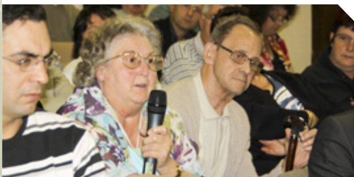
13 septembre 2010, Réunion Publique Grands Projets