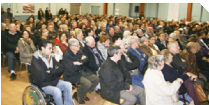
Réunion publique (2009) Présentation du projet du Louvre Lens