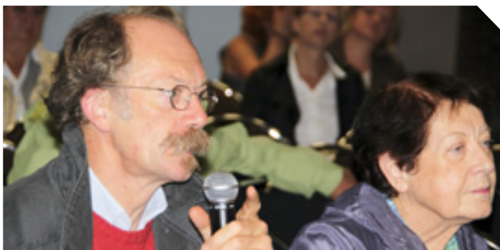
8 septembre 2010, Réunion Publique Proximité