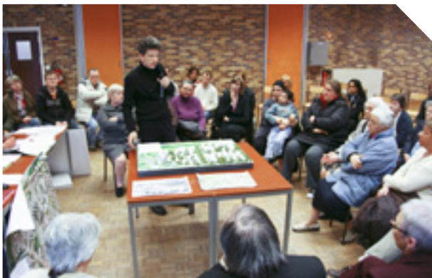
Atelier urbain à la Grande Résidence

La Gestion Urbaine de Proximité concrétisée par la mise en place des Ateliers Urbains de Proximité , accompagne les projets ANRU (démolition et reconstructions de logements, rénovations et développement du Quartier).