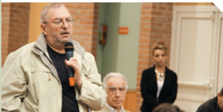
17 septembre 2010, Réunion Publique Mobilité